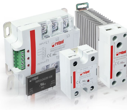
Przekaźniki półprzewodnikowe RSR