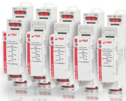
Przekaźniki instalacyjne RPI