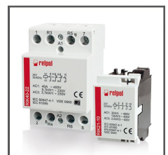
RIK styczniki instalacyjne