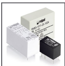
Przekaźniki subminiaturowe i miniaturowe