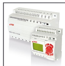
Przekaźniki programowalne NEED