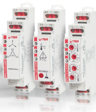
Przekaźniki nadzorcze RPN