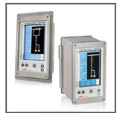
CZIP®-PRO – systemy cyfrowych zabezpieczeń SN