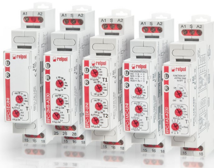
Przekaźniki czasowe RPC