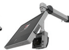
PANELE HMI + RAMIONA NOŚNE