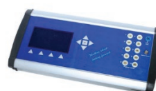
OBUDOWY DO ELEKTRONIKI