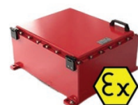
KOMPONENTY DO STREFY EX

Standardowe obudowy przemysłowe tej marki wykonane są z aluminium, stali nierdzewnej i tworzywa sztucznego. W ofercie znajdują się również: obudowy paneli operatorskich, przeznaczone do aplikacji HMI z wykorzystaniem przemysłowych komputerów PC, systemów PLC wraz z systemami ramion nośnych, a także komponenty do ochrony przed wybuchem, w tym skrzynki rozdzielcze i stacje kontrolne EX-e oraz EX-d według wymagań danej aplikacji.