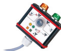
PRESONALIZACJA + INTEGRACJA

ręczne, biurkowe, konsolowe i montowane na ścianie obudowy, w tym również aplikacje 19". Dodatkowo w ramach naszych usług proponujemy produkcję indywidualnych obudów plastikowych i metalowych oraz ich komponentów.