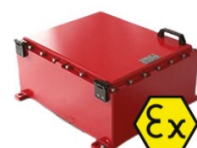
KOMPONENTY DO STREFY EX

Standardowe obudowy przemysłowe tej marki wykonane są z aluminium, stali nierdzewnej i tworzyw sztucznych. W ofercie znajdują się również: obudowy paneli operatorskich, przeznaczone do aplikacji HMI z wykorzystaniem przemysłowych komputerów PC, systemów PLC wraz z systemami ramion nośnych, a także komponenty do ochrony przed wybuchem, w tym skrzynki rozdzielcze i stacje kontrolne EX-e oraz EX-d według wymagań danej aplikacji.