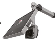
PANELE HMI + RAMIONA NOŚNE