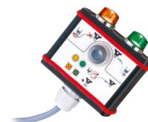
PERSONALIZACJA + INTEGRACJA

ręczne, biurkowe, konsolowe i montowane na ścianie obudowy, w tym również aplikacje 19". Dodatkowo w ramach naszych usług proponujemy produkcję indywidualnych obudów plastikowych i metalowych oraz ich komponentów.