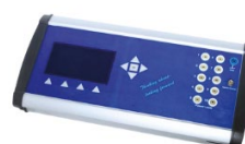
OBUDOWY DO ELEKTRONIKI