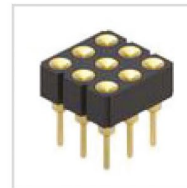
Złącza i przewody