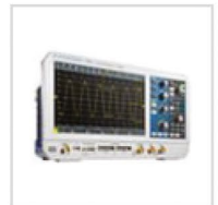
Urządzenia testowe i pomiarowe